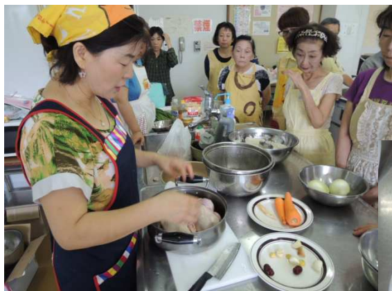
キム先生の丁寧な説明