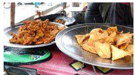
パキスタンの屋台で売られているパコラ（左・野菜かき揚げ風）とサモサ（右・揚げ餃子風）

パキスタンの方々も照れ屋なところは日本人同様ですが、友好的で、触れ合えると楽しい方々ばかりです。この機会に友達を作ってはいかがでしょう！ 申込不要！入場無料！