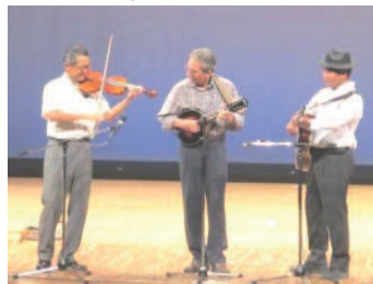
アメリカ音楽ブルークラス