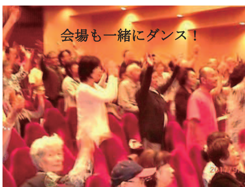
会場も一緒にダンス！