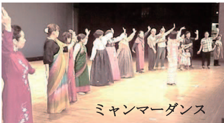
ミャンマーダンス