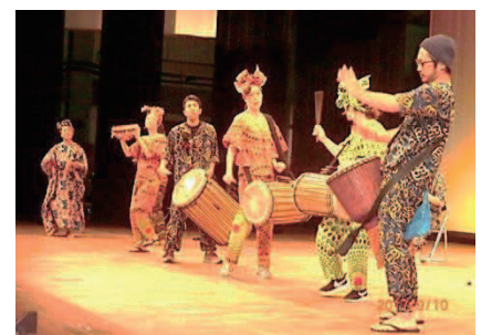
アフリカダンスとジェンベ演奏