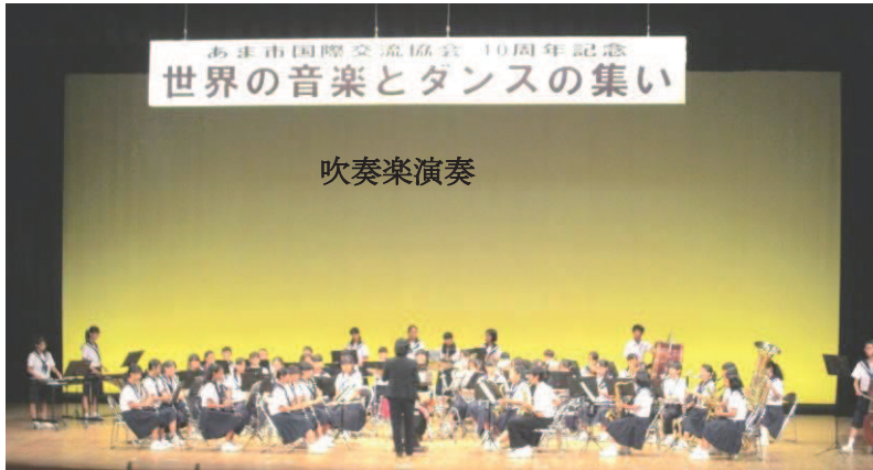
あま市国際交流協会 10周年記念 世界の音楽とダンスの集い