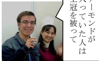
アーモンドが 入ったモン ドを被った 王冠は フランス人 の象徴

＊ACIA「ミーティング（定例会）」：毎月第1土曜日（祝日の場合は第2土曜日）に甚目寺公民館で 集まって話し合いをしています。どなたでも参加できます。