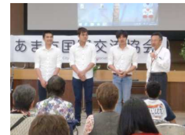
外国人参加者の自己紹介 ベトナム人・ネパール人 (美和日本語教室受講生)