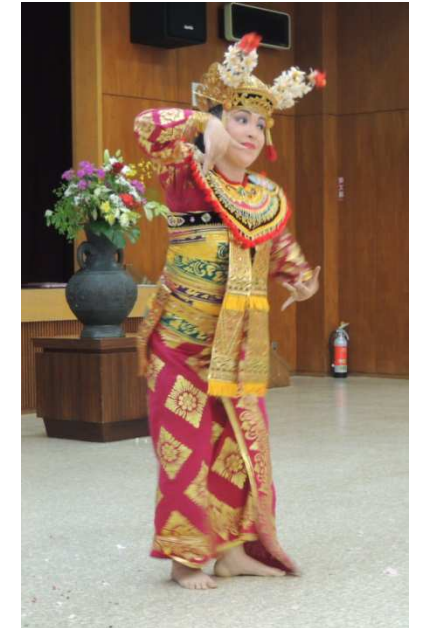
来場者全員でバリ舞踊体験