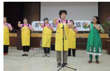
団体会員等の活動紹介