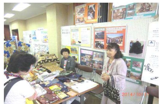
カラのアフリカ雑貨出展ブース